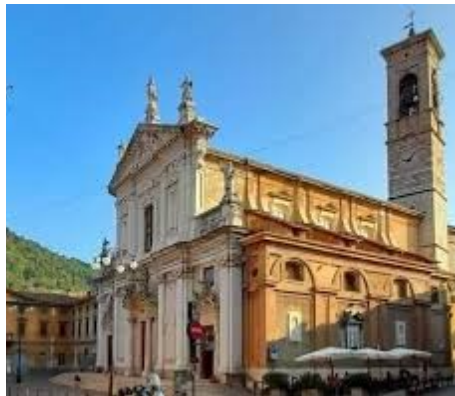
Basilica di San Martino